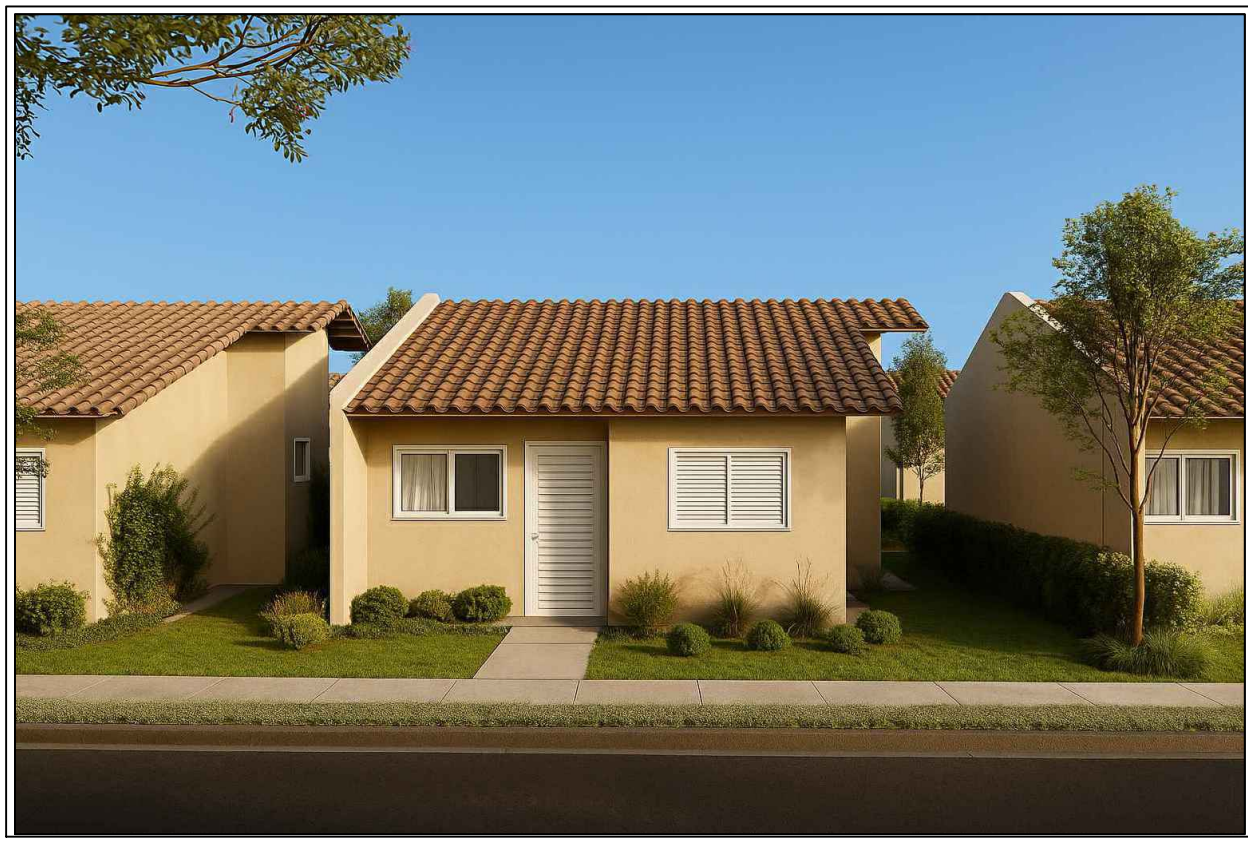
10 MAQUETE ELETRÔNICA ESCALA 1/75